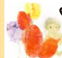
いわさきちひろ チューリップのなかのあかちゃん 1971年

港区立 男女平等参画センター リーブラホール ※事前にみなとコールにて お申し込みください