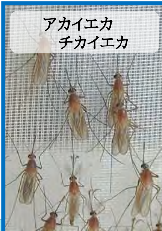
アカイエカ チカイエカ