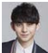
タレント ハリー杉山 さん